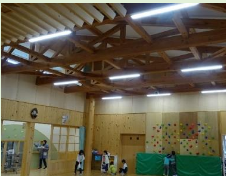
木曾町「三岳保育園」で使用されている信州プレミアムカラマツ

民有林材と国有林材を合わせて平成29年度から販売を開始し、今までの最高単価(1m 3 当たり)は平成30年度に記録した45,000円でしたが、令和4年度に51,000円の高値に更新されました。