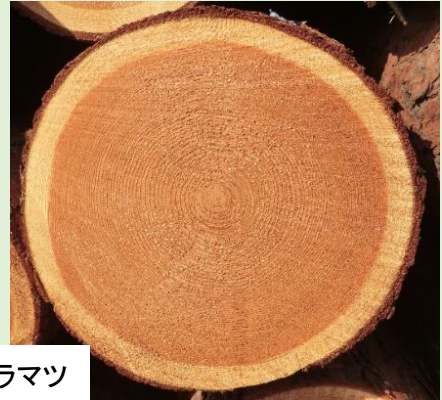
信州プレミアムカラマツ