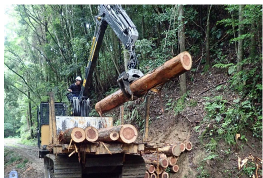
【フォワーダによる積込み】