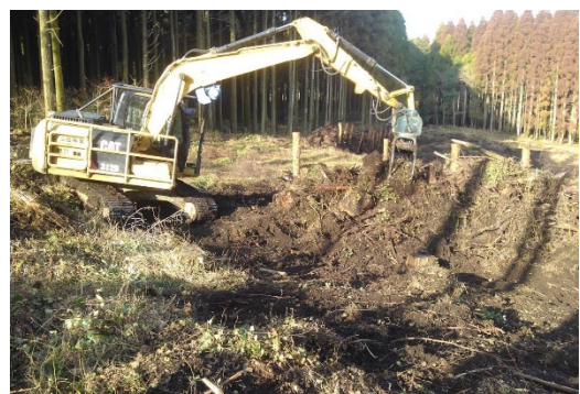
【グラップルによる地拵え】