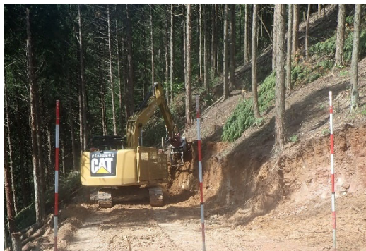
【フェラーバンチャによる路網作設】