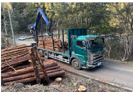
【トラックによる運搬】