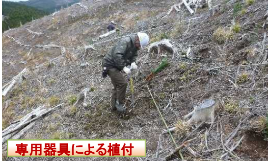
専用器具による植付