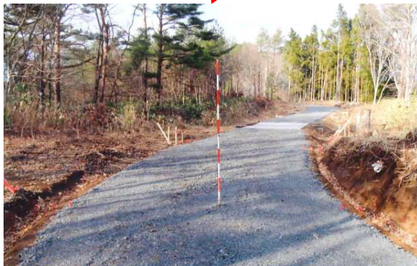
路網整備 (西白河郡西郷村)