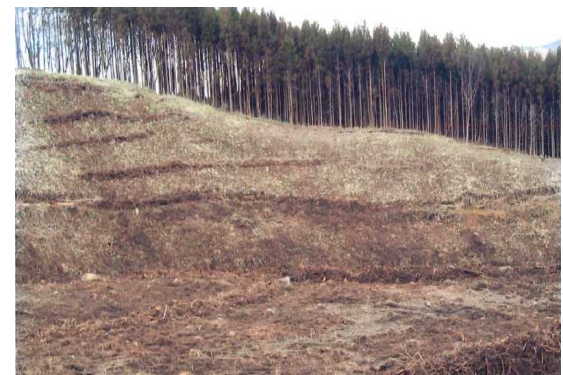
地拵、植付 (石川郡古殿町)