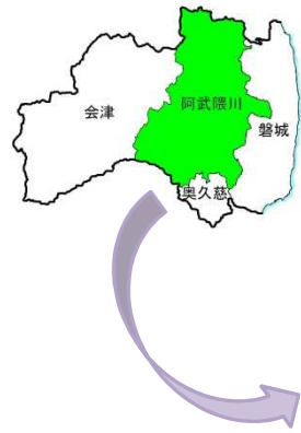
<福島森林管理署白河支署管内図>