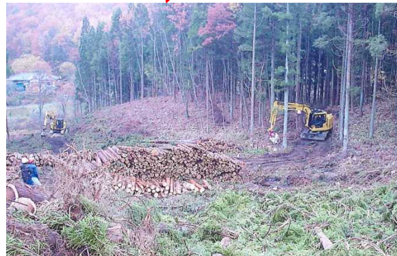
高性能林業機械の導入による作業効率の向上 (石川郡平田村)