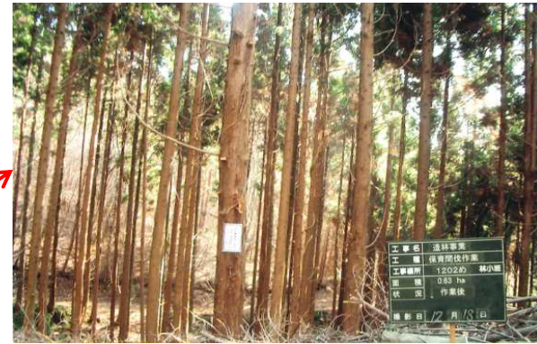
保育間伐 (石川郡石川町)