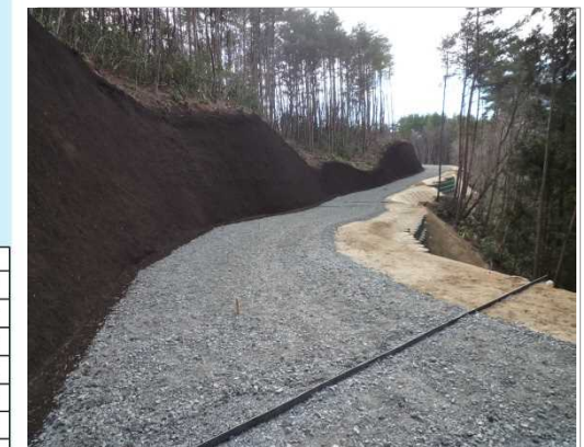
林業専用道新設工事