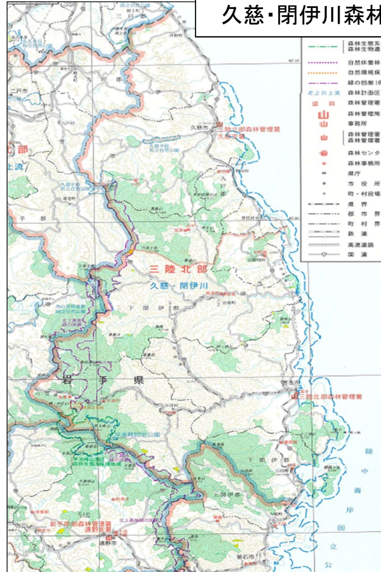
久慈・閉伊川森林計画区