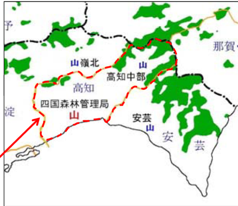
対策森林計画区拡大図