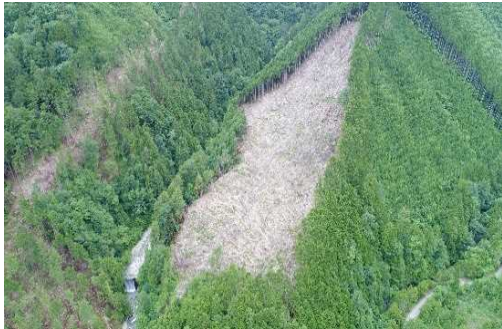
木曽森林管理署南木曽支署（ドローンで撮影）