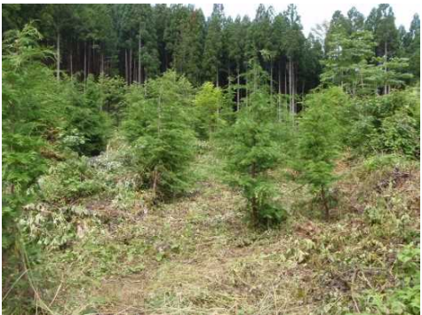
木曽森林管理署 南木曽支署