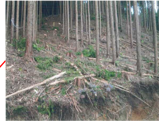
間伐 によらい (大田原市如来入国有林)