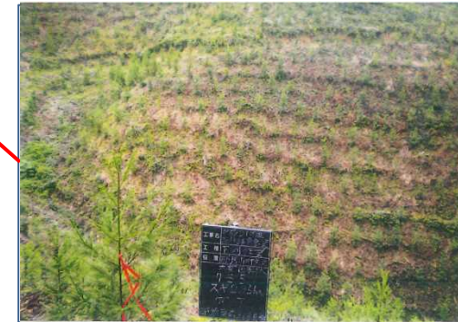
下刈 おおむろ (那珂川町大室国有林)