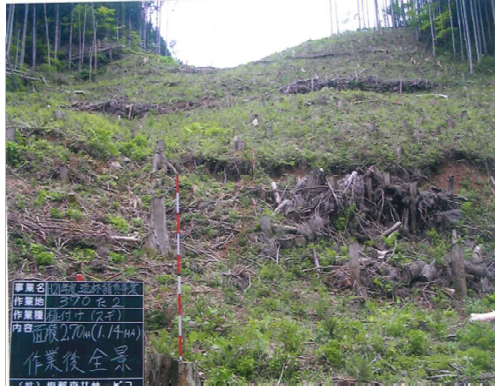
植付 にしやま (那須塩原市西山国有林)