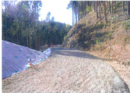
路網整備 おおむぐり (那須烏山市大禰国有林)