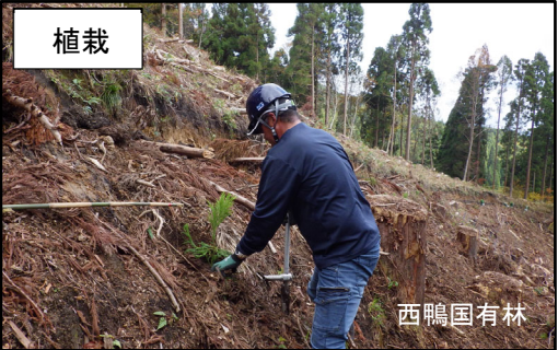
隣接の天神川森林計画区にて