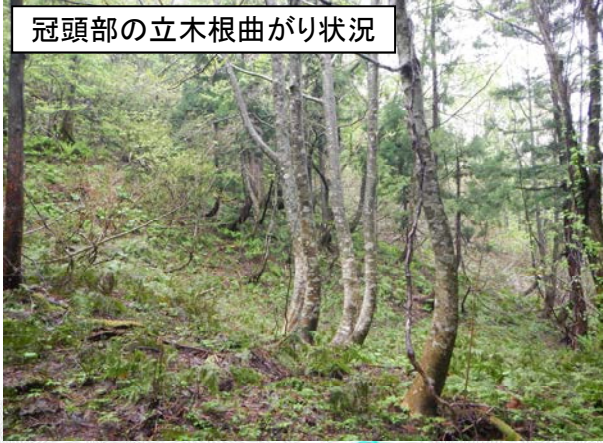
冠頭部の立木根曲がり状況