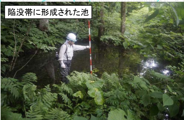
陥没帯に形成された池