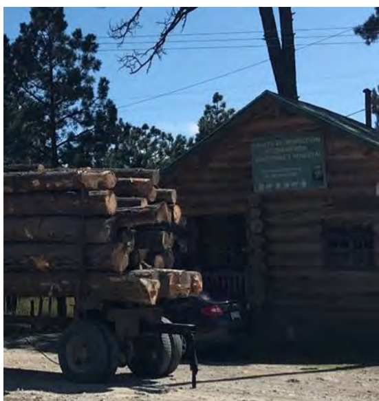
図 4.6.8 監視所（チワワ州ベルヘル市）