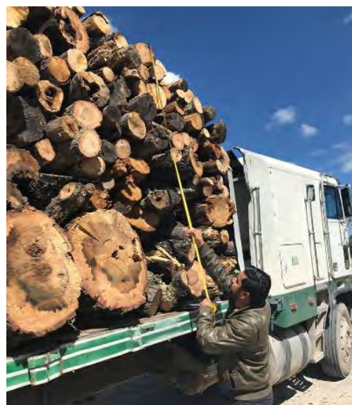
図 4.6.9 丸太積載量の検査（チワワ州ベルヘル市）

PROFEPA は製材所の検査を実施し、丸太輸送許可証、木材積み替え許可証、領収書等を確認する。SEMARNAT に記録された歩留まり率に基づき、PROFEPA はインプット（製材所に輸送された丸太材積量）からアウトプット（生産された木材材積量）を推定する。推定されたアウトプット量と木材積み替え許可証に記録された木材合計量に大きな違いがある場合には、PROFEPA は SEMARNAT に報告し、行政処分（丸太・木