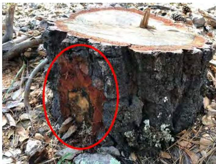
図 4.6.3 伐採された松（伐採予定を示す印：根元）

森林管理プログラムが承認された後、森林技師は、伐採予定木インベントリー（図 4.6.2）を SEMARNAT に提出し、森林で伐採予定木に印をつける（図 4.6.3）。