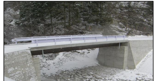
東濃森林管理署 夕森田立(丸野)橋梁架設工事