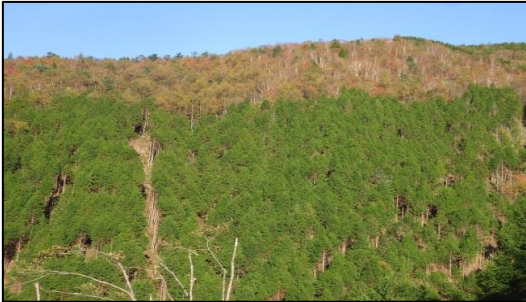
東濃森林管理署 間伐