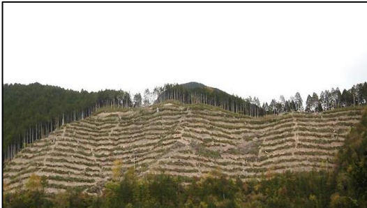
東濃森林管理署 地拵