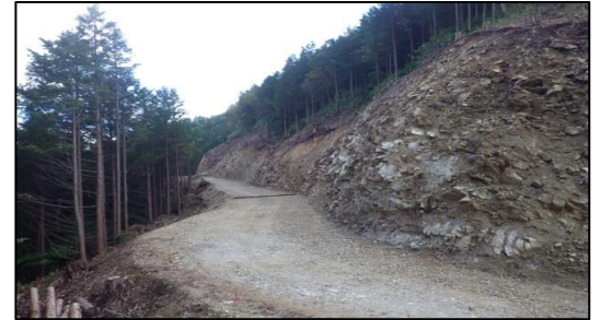
東濃森林管理署 高時山(カシモ谷)林道新設工事