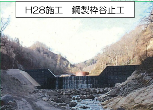
H28施工 鋼製枠谷止工