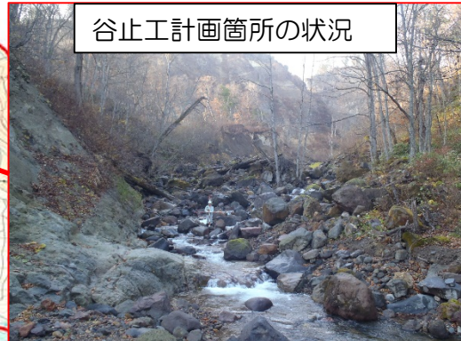
谷止工計画箇所の状況