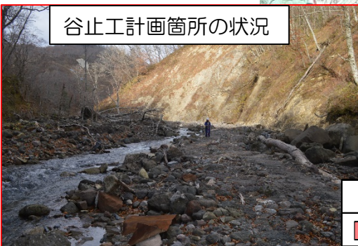
谷止工計画箇所の状況