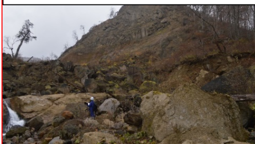
尾根部崩落による土砂等の堆積状況