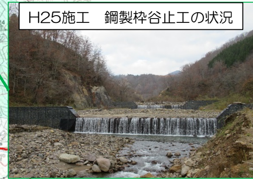
H25施工 鋼製枠谷止工の状況