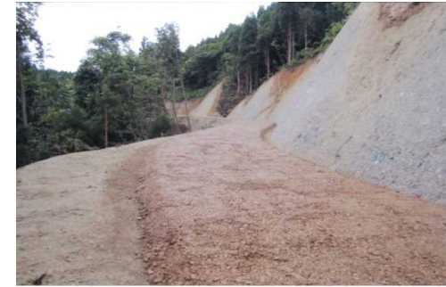
岩瀬沢外1国有林 (下刈)