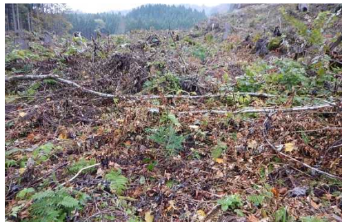
奥見内沢外6国有林 (植付)