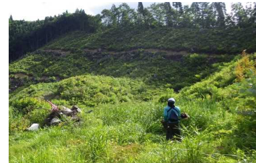
岩瀬沢外1国有林 (下刈)