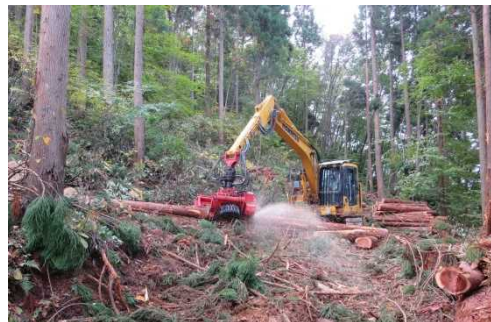
仙戸石沢外3国有林 (保育間伐)