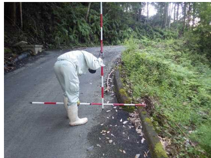
② 平成20年に確認した地すべりによる林道路側変形状況