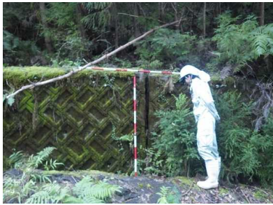
③ 平成20年に確認した地すべりによる擁壁の被災状況