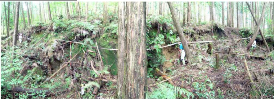
⑤ 平成20年に確認した地すべりによる開口亀裂の状況