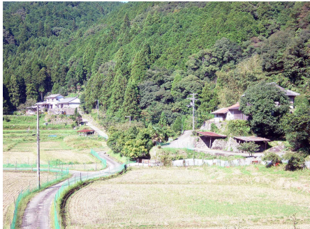
① 保全対象 (熊野川町日足集落)