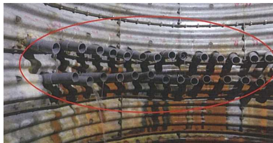
④ 地すべりの影響による集水機能の低下 ポーリング孔口の方向が不均一 (集水井内)