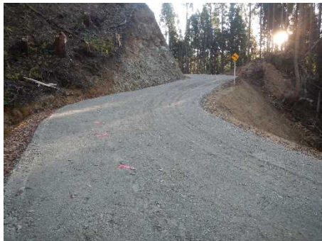
林道（林業専用道）新設