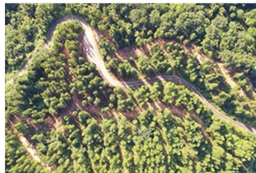
扇平外国有林（間伐）