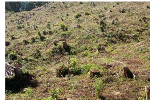
櫛頭外国有林（下刈）