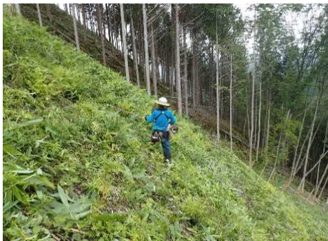
岐阜森林管理署（下刈）