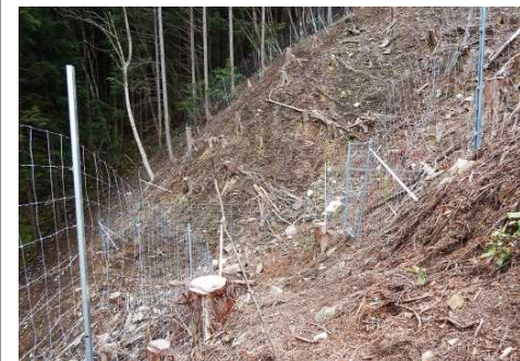
岐阜森林管理署（シカ防護柵）