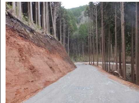
岐阜森林管理署 ミススリ林道 新設工事