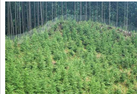
岐阜森林管理署（シカ防護柵）