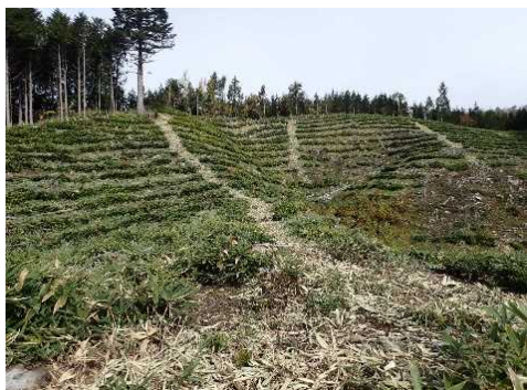
岐阜森林管理署（地拵え）