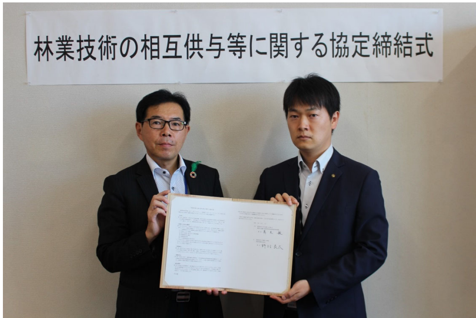
【左：島根森林管理署長、右：島根県農林水産部長】