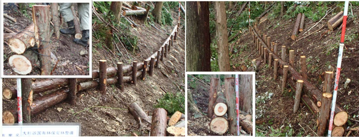
写真-1 鉄線緊結式 完成状況