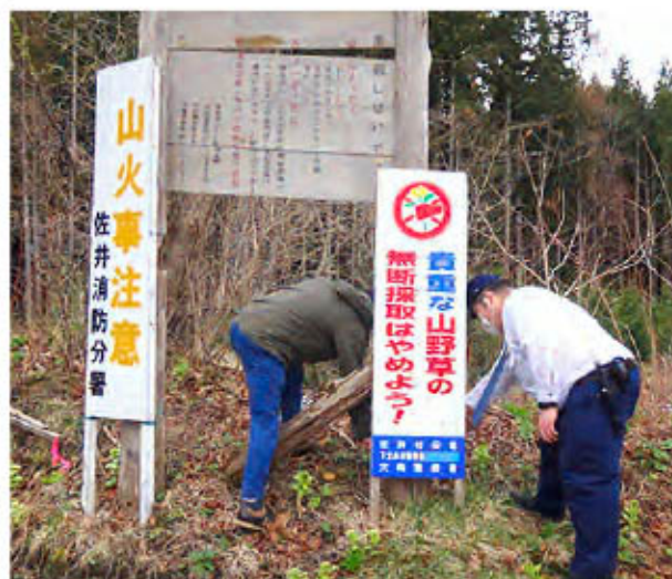
盗掘防止看板の点検

当署では、このような取組を地域とともに継続していくことにより、森林保全に対する意識とマナーがより一層深まっていくものと期待しています。