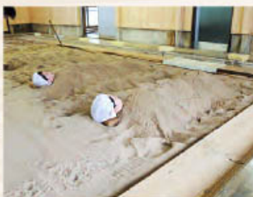
槻沢温泉「砂ゆっこ」

開放されます。毎年7~10月頃には、滝を七色に彩るナイトイベント「錦秋湖大滝ライトアップ」も開催! 東北初の砂風呂として平成2年に誕生した槻沢温泉「砂ゆっこ」、湯本温泉からほど近く、町内で産出された天然珪砂を温泉で熱し、浴