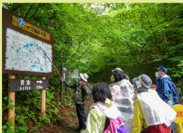
案内図の前でガイドの説明を聞く参加者

当日は、青森県内から児童3名を含む11名が、初夏のブナ林と湖沼巡りに参加し、共催の深浦町から2名のガイドを派遣していただき、十二湖の見所について案内してもらいました。