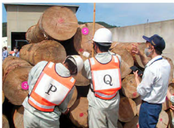
高校生による丸太検知の様子

この体験では、丸太の品質等により計測方法に違いがあること、スマートフォンによる本数・材積等の自動計測に関心を示す生徒が多くいました。