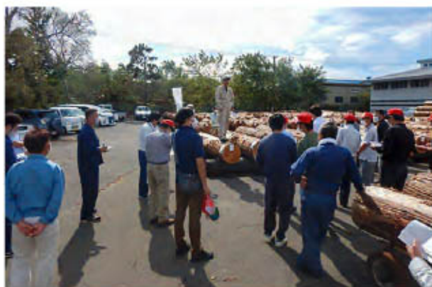
秋田県銘木センターのせり売り

令和3年度は、高齢級秋田杉（林齢100年生以上）を617m 3 生産し、委託販売（せり売り）しました。令和4年度は高齢級秋田杉300m 3 の生産を予定し、虫害時期を避けた9月以降に販売することとしています。