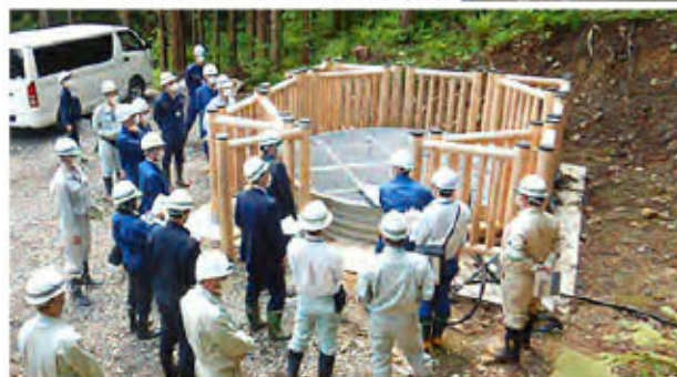
岩手県と雫石町職員との合同現地調査

引き続き、地元関係機関との連絡調整を図り、国土及び住民生活を守るため、対策効果の早期発現に向け、志戸前川地区の地すべり防止事業に一層取り組んでまいります。