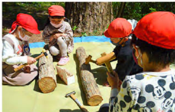
園児たちがきのこの駒打ちをしている様子

初めての作業に、最初は戸惑う子もいましたが、先生やセンター職員と一緒に駒を打っていくうちにすぐに慣れて、元気いっぱい次々とほだ木に駒を打ち込んでいきました。園児たちは「意外と簡単だった」と喜んでいました。