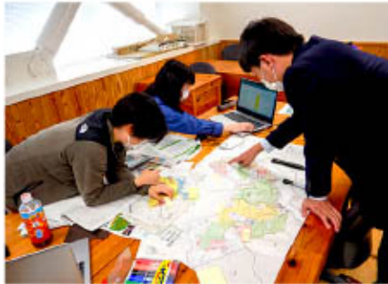
山の地図の見方を学ぶ

現在、自治体の職員の皆様向けに次の5つの研修を企画しています(局実施分のみ掲載)。