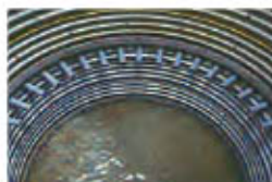
集水井工（直径3.5m、深さ34m） 井内の地下水排除の様子(右)

現在は主に地すべりの原因となる地下水を集め排水する集水井工（集水する井戸）を施工しております。