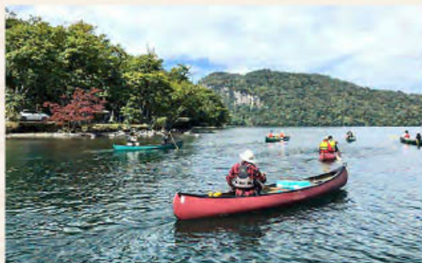
湖と森の不思議を体感するネイチャーツアー

また、キャンプ場発着のカナディアンカヌーツアー（Towadako Guidehouse 権（かい） 催行）は、初心者も参加可能で雄大な十和田湖を満喫できます。同じく場内にあるトウヒ材を使った樽型サウナ（十和田サウナ）も人気のアクティビティのひとつとなっています。