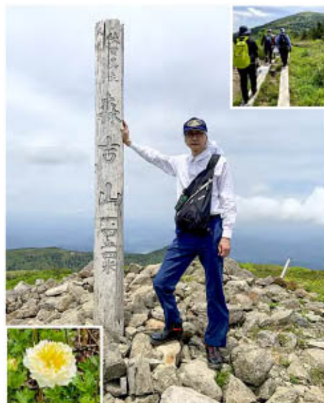
地域の方々と協力しながらの清掃登山

引き続き、地域の方々の情報交換を通じて繋がりを大切にした業務に取り組んでいきたいと考えています。