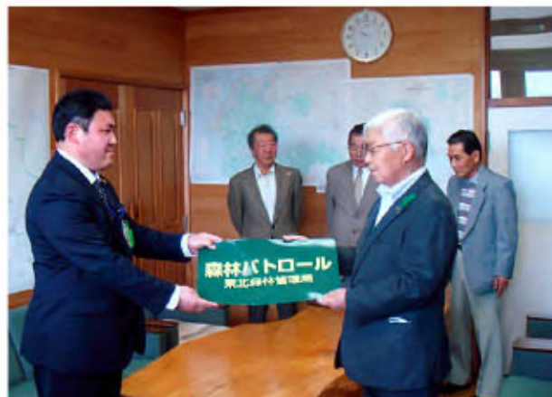
森林パトロール依頼証明書などの交付の様子

交付式では、当署署長より弘南森の会・西北森の会両会長へ、パトロール依頼証明書と、森林パトロールステッカーや腕章の交付を行いました。