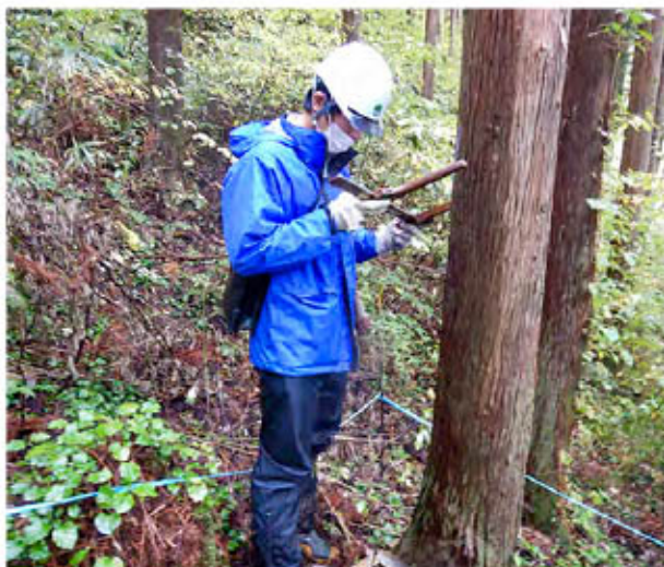
直径計 輪尺を使用して木の直径を計測

研修に参加を希望される自治体職員の方は、東北森林管理局総務課(018-836-2173)へお問い合わせ下さい。