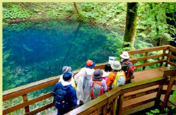
神秘的なコバルトブルーの青池

参加者は2組に分かれ、それぞれガイドの案内で、原生林に囲まれた迫力たっぷりの「鶏頭場の池」、コバルトブルーの「青池」、透明度の高い「沸壺の池」や、新緑のブナやカツラ、希少な植物など白神山地の色彩を楽しみながら散策しました。特に、青池は曇り空ながら、とても綺麗な青い色を見せてくれました。