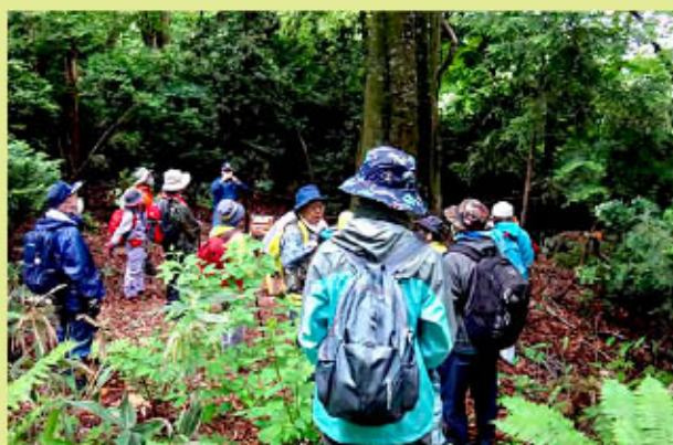
ブナの巨木に圧倒される参加者

出発前、十二湖内の森の物産館キョロコ駐車場において開会式を行い、高木センター所長より「自然豊かな森林をはじめ、十二湖畔や日本キャニオンなどの景勝地を見ながら、白神山地の生態系を学び森林浴を堪能してください」との挨拶後、準備体操で体をほぐし、ブナ林と湖沼巡りを開始しました。