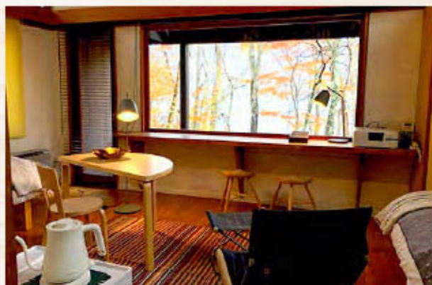
ワーケーションにも最適な空間

長期滞在中に仕事をするスタイルもこれから増えていくと思われ、国立公園内も少しずつワーケーション設備を整えております。キャンプ場でもプリンターやWi-Fiを設置した「北奥“hokuou”コテージ」があります。コテージの窓からは四季折々十和田湖を眺められるので、自然の中に身を置きながら仕事をする事ができます。コテージ内は北欧雑貨やフィンランドで生まれた建築家、アルヴァ・アアルトの家具で揃えられ、癒しの空間となっております。