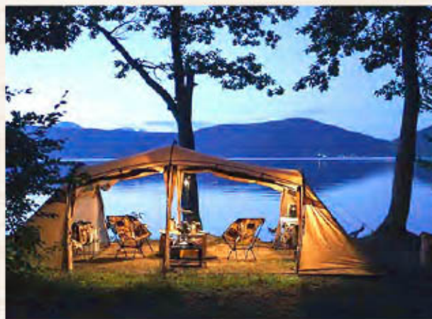
十和田湖畔の眺めも美しい

周辺には乙女の像や十和田神社がある休屋地区や、奥入瀬渓流など人気の景勝地も近いことから、観光をするための拠点としての利用も可能です。