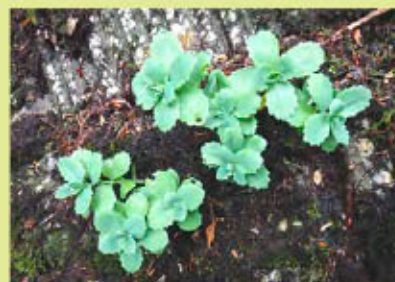
白神山地周辺に分布する「ツガルミセバヤ」

あいにくの天候によりコース変更もありましたが、ガイドさんの説明で、十二湖の成り立ちや様々な植物のことができて、参加者の皆さんも例年以上に有意義な時間を過ごすことが出来たと思います。