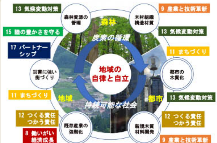
木高研の研究分野とSDGsの関係

ご関心のある方は、秋田県立大学・木材高度加工研究所 (Tel.0185-52-6900)へお問い合わせ下さい。