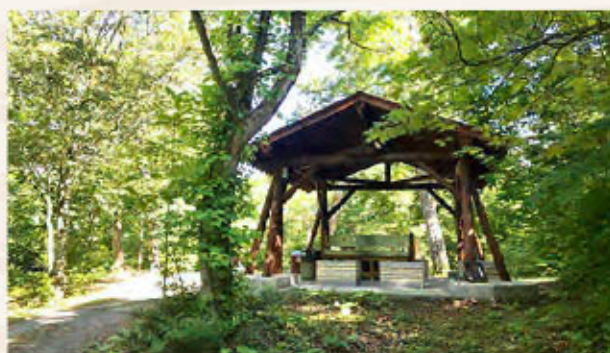
野趣溢れる中でキャンプが楽しめる

十和田市宮宇樽部キャンプ場（青森県十和田市大字奥瀬字宇樽部64林班イ小班）は、奥州山脈の北側、標高約400mの場所に位置する十和田湖の湖畔にあります。十和田八幡平国立公園内にあり、ブナ・ミズナラ・カエデといった落葉広葉樹が広がり、野趣溢れる場内と湖畔から眺める十和田湖の景観が人気です。