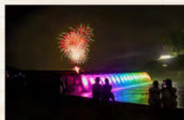
七色にライトアップ

錦秋湖は湯田ダムによりできた人造湖。その上流部に2002年に建設された幅123m、高さ17.5mの貯砂ダムが「錦秋湖大滝」(正式名称:湯田貯砂ダム)です。水が流れ落ちる様子を滝の内側にある通路から鑑賞できます。巨大な水のカーテンに例えられ、水位が低くなる時期に一般