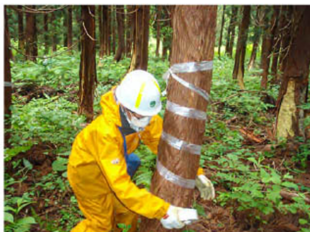
防護用テープを巻く様子

当署では、クマ剥ぎを防ぐため樹木にテープを巻いて、被害を防いでいます。クマが樹皮を剥がそうとしたときに、邪魔になるテープを嫌がることで予防になります。