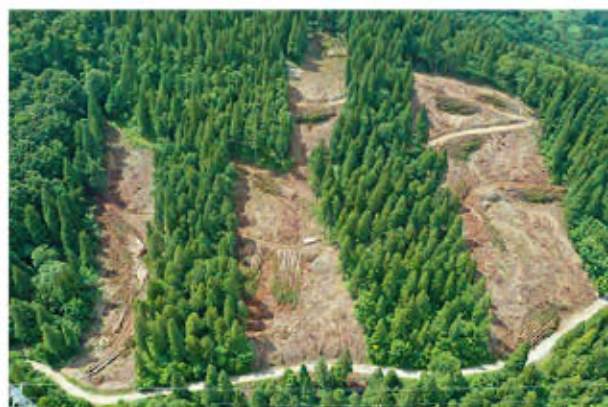
伐採後に植林し、様々な樹木で構成される森林へ

次の写真は、令和3年度の事業で、単層林の一部を伐採し、再び森林を造り（再造林）、複層林（樹齢が違い、高さの異なる樹木で構成される森）へと誘導している過程です。複層林は一度に伐採する面積を小分けにして伐採、再造林していくことで、森林の持つ公益的機能を持続させながら、安定的な木材供給との両立を目指しています。